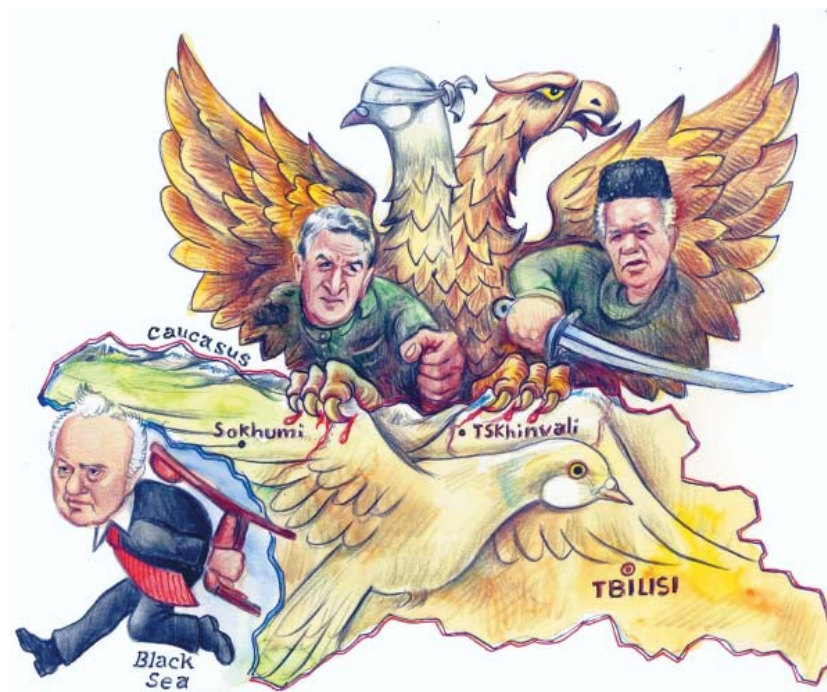
იღვის ავტორი: აკაკი მუმლაძე მხატვარი: გაბრიელ ველიჯანაშვილი