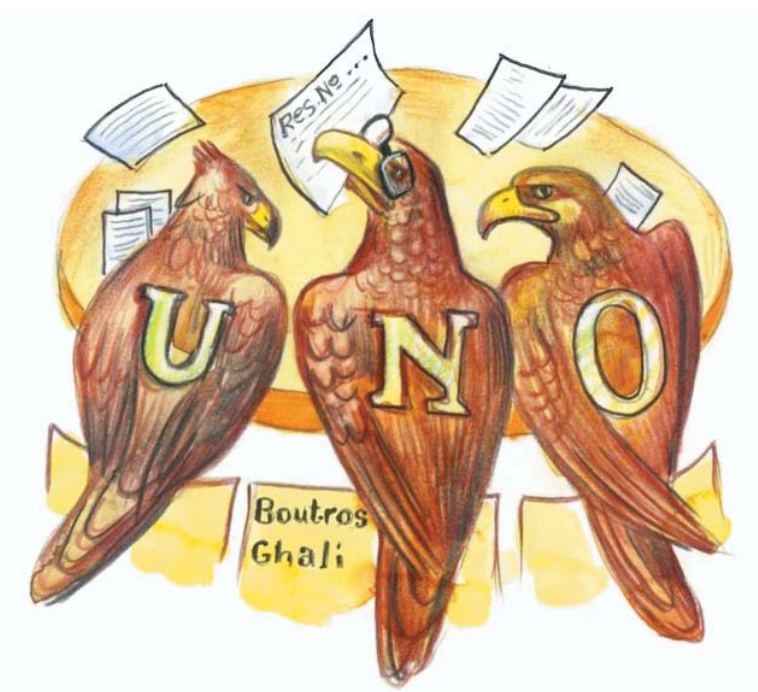
რეზოლუციებს ჩვენ არ მოგაკლებთ!