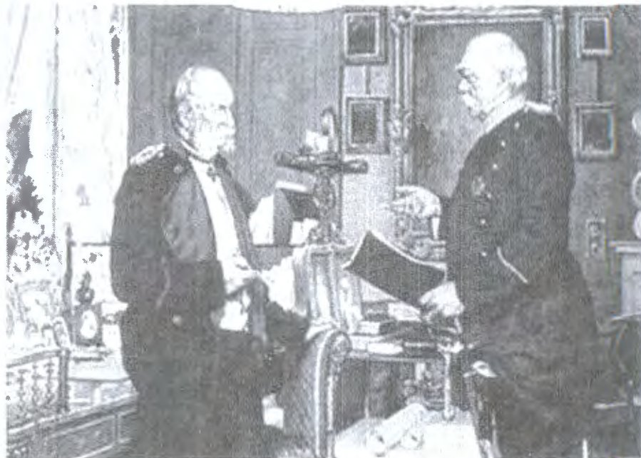
ბისმარკი (მარჯვნივ) და ვილჰელმ I, გერმანიის იმპერიის კაიზერი და პრუსიის მეფე, კონრად ზიმენროტის აკვარელი, 1887 წელი.