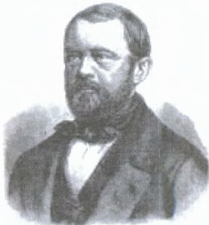
ოტო ფონ ბისმარკი, ლანდტაგის დეპუტატი. 1848 წელი