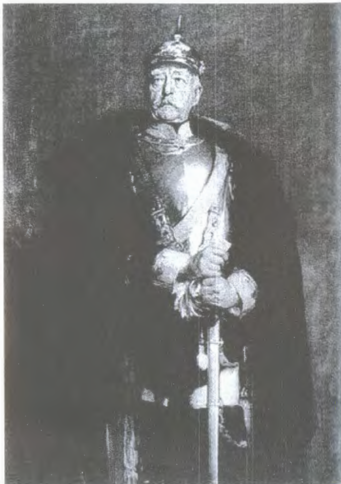
რეისკანცლერი ოტო ფონ ბისმარკი. ლითოგრაფია ვ. პეტერსენის ორიგინალის მიხედვით. XIX საუკუნის დასასრული