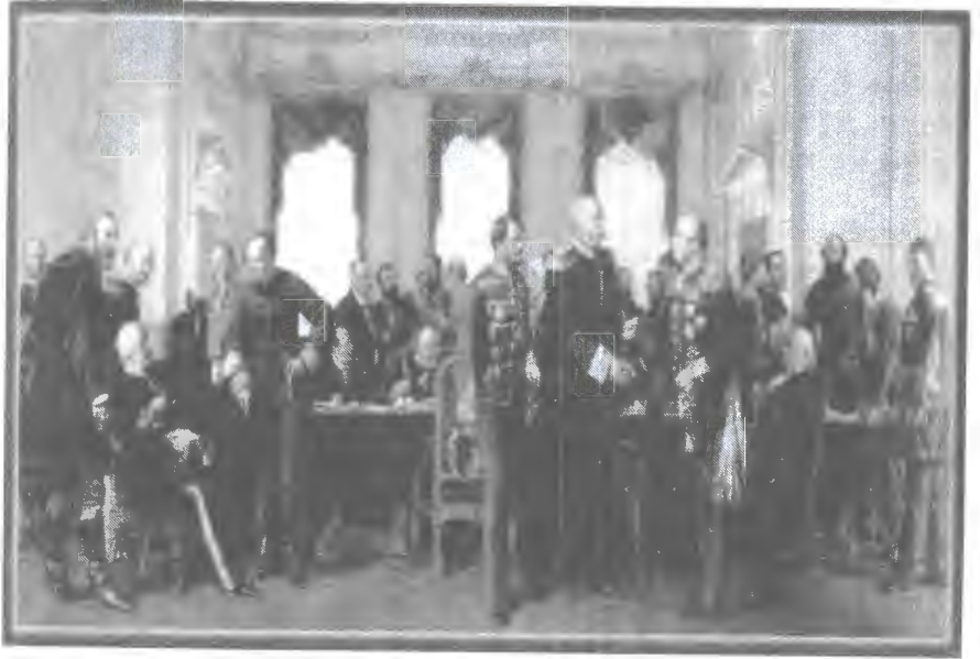
ბისმარკი ბერლინის კონგრესზე 1878წელს