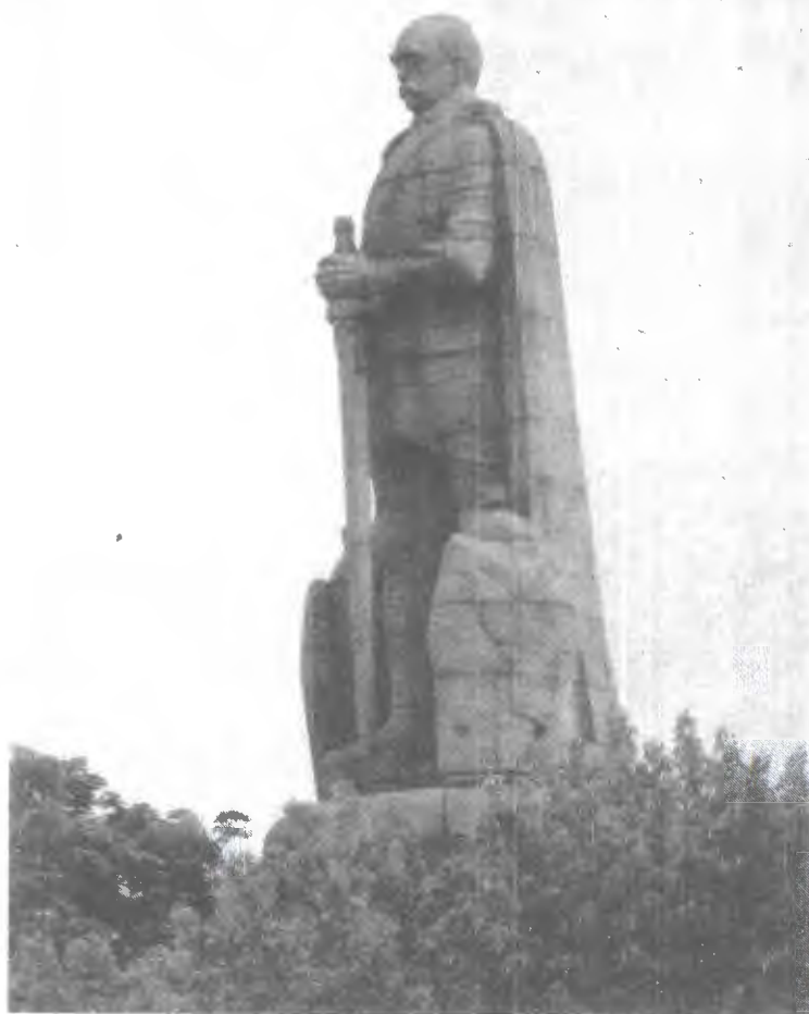
ბისმარკის ქანდაკება ჰამბურგში