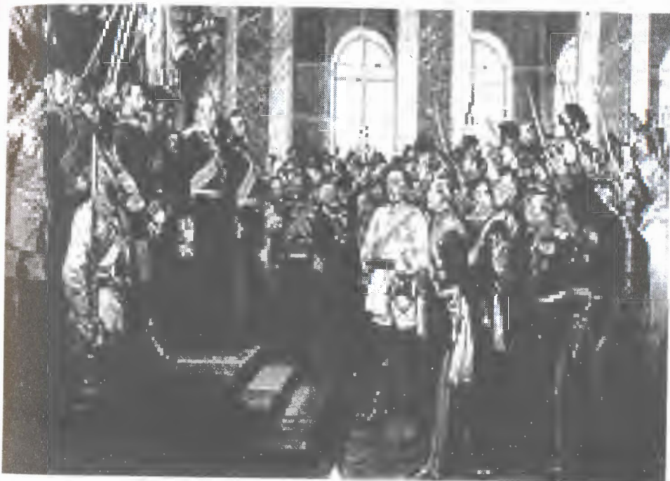
გერმანიის იმპერიის გამოცხადება, 1871 წელი, 18 იანვარი, ვერსალი