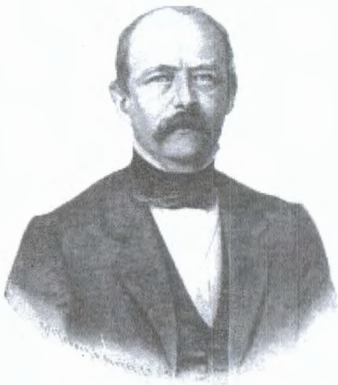
ბისმარკი, პრუსიის მინისტრ-პრეზიდენტი. 1863 წელი