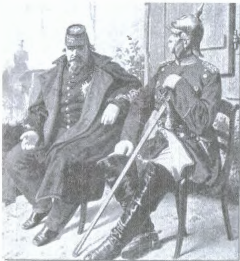
ნაპოლეონ III და ბისმარკი