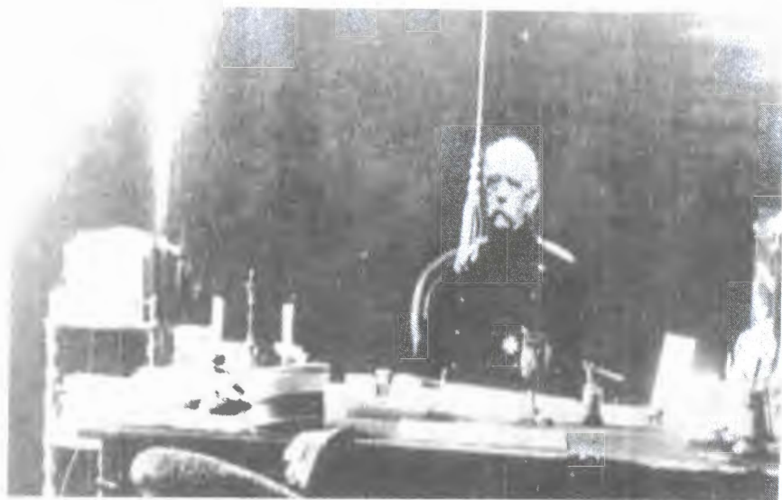
ოტო ფონ ბისმარკი. სამუშაო კაბინეტში, რეიხსკანცელარიაში